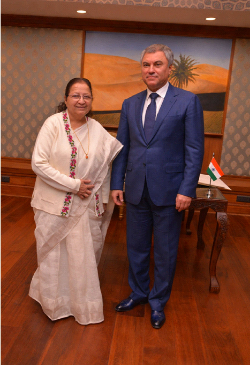
Lok Sabha Speaker, Smt. Sumitra Mahajan with Chairman of the State Duma of the Federal Assembly, H.E. Mr. Vyacheslav Volodin in Parliament House Annex Extension Building on 10 December, 2018.