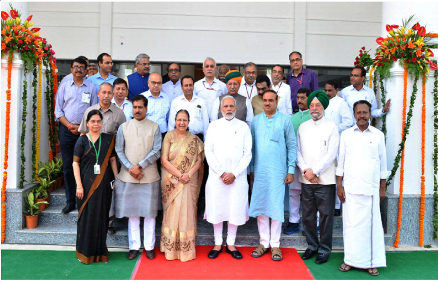
Prime Minister, Shri Narendra Modi; Lok Sabha Speaker, Smt. Sumitra Mahajan; Deputy Speaker, Lok Sabha, Dr. M. Thambi Durai; Union Minister of Parliamentary Affairs and Chemicals and Fertilizers, Shri Ananth Kumar; Minister of State (Independent Charge) for Housing and Urban Affairs, Shri Hardeep Singh Puri; Union Minister of State for Parliamentary Affairs and Water Resources, River Development & Ganga Rejuvenation, Shri Arjun Ram Meghwal; Members of Parliament and other dignitaries after the inauguration of the Western Court Annexe at Janpath, New Delhi on 4 April, 2018.