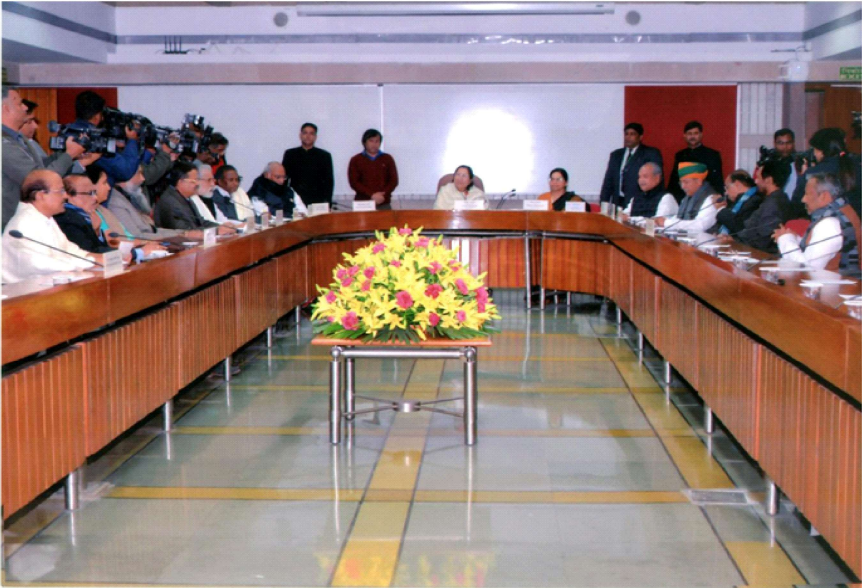
Lok Sabha Speaker, Smt. Sumitra Mahajan at a meeting with the Leaders of Parties in Lok Sabha, in the Parliament Library Building on 30 January 2019.