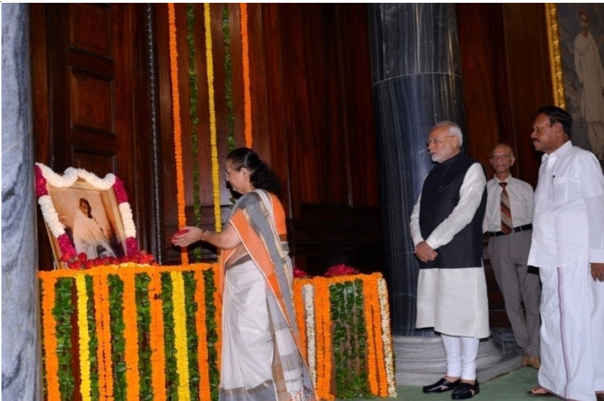
Lok Sabha Speaker, Smt. Sumitra Mahajan paying floral tributes at the portrait of Mahatma Gandhi in the Central Hall of Parliament House on the occasion of his birth anniversary on 2 October, 2018.