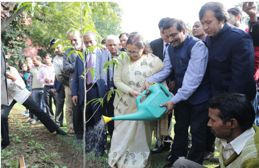
Lok Sabha Speaker, Smt. Sumitra Mahajan planting the 'Ashoka Tree' in Indian Institute of Mass Communication (IIMC) in New Delhi on 7 December, 2018.