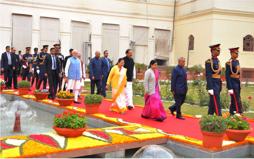
Hon'ble President of India, Shri Ram Nath Kovind arriving in the Central Hall of Parliament House to address the Members of both Houses of Parliament assembled together on 31 January 2019.