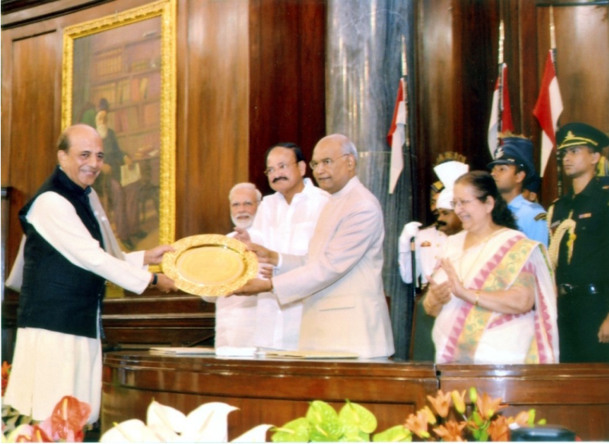
Honourable President, Shri Ram Nath Kovind presenting Outstanding Parliamentarian Award to Shri Dinesh Trivedi, MP (LS) at the function to confer the Awards for Outstanding Parliamentarians to be held in Central Hall of Parliament House on 1 August, 2018. Honourable Vice-President and Chairman, Rajya Sabha, Shri M. Venkaiah Naidu; Honourable Prime Minister, Shri Narendra Modi; Honourable Speaker, Lok Sabha, Smt. Sumitra Mahajan are also seen in the photograph.