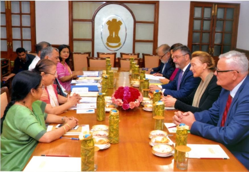
Lok Sabha Speaker, Smt. Sumitra Mahajan with the delegation led by Dy. Prime Minister and Foreign and European Affairs Minister of Croatia, H.E. Ms. Marija Pejcinovic Buric in Parliament House, New Delhi on 22 October, 2018.