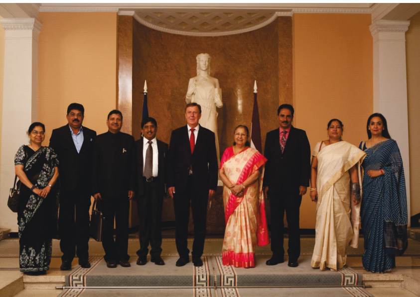
Lok Sabha Speaker, Smt. Sumitra Mahajan and members of Indian Parliamentary Delegation with the Prime Minister of Latvia, Mr. Maris Kucinskis in Riga on 14 June, 2018.