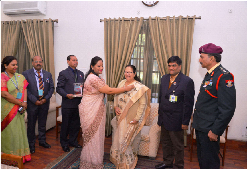
Officers of Kendriya Sainik Board pinning flag on Lok Sabha Speaker, Smt. Sumitra Mahajan on the occasion of the Armed Forces Flag Day on 7 December, 2018.