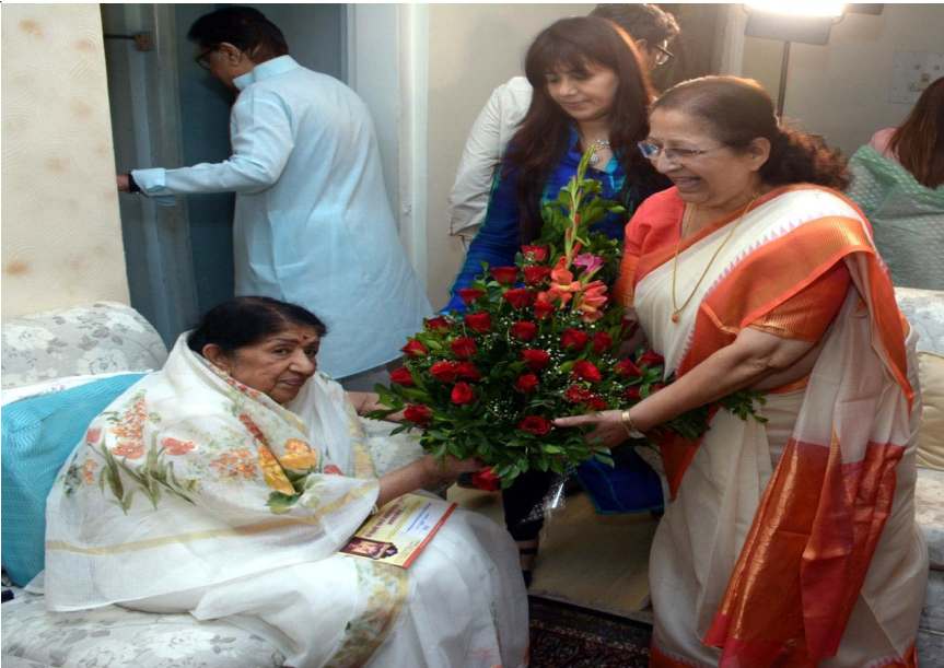
Lok Sabha Speaker, Smt. Sumitra Mahajan met Bharat Ratna Ms. Lata Mangeshkar at her residence in Mumbai on 28 September, 2018.