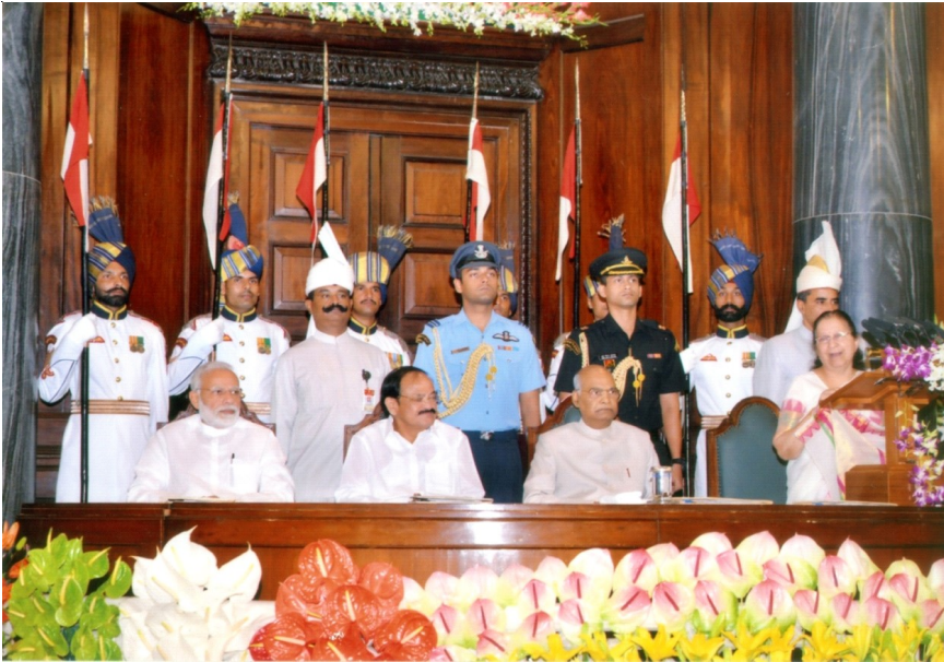
Honourable President, Shri Ram Nath Kovind, Honourable Vice-President and Chairman, Rajya Sabha, Shri M. Venkaiah Naidu; Honourable Prime Minister, Shri Narendra Modi; Honourable Speaker, Lok Sabha, Smt. Sumitra Mahajan at the function to confer the Awards for Outstanding Parliamentarians to be held in Central Hall of Parliament House on 1 August, 2018.