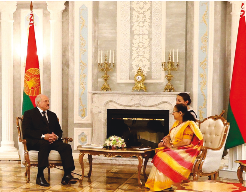
Lok Sabha Speaker, Smt. Sumitra Mahajan with the President of Belarus, Mr. Alexander Lukashenko in Minsk (Belarus) on June 12, 2018.