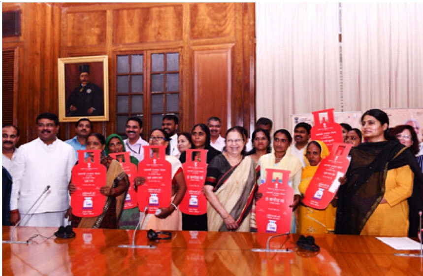
Lok Sabha Speaker, Smt. Sumitra Mahajan handing over 5 croreth connection to the beneficiary of Pradhan Mantri Ujjwala Yojana in the presence of Union Minister of Petroleum & Natural Gas, Shri Dharmendra Pradhan in the Parliament House on 3 August, 2018.