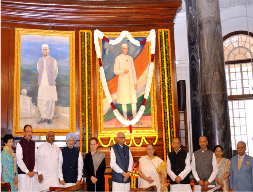
Lok Sabha Speaker, Smt. Sumitra Mahajan; Former Prime Minister, Dr. Manmohan Singh; Leader of Opposition in Rajya Sabha, Shri Ghulam Nabi Azad; Minister of State for Parliamentary Affairs and Statistics and Programme Implementation, Shri Vijay Goel; Chairperson of Public Accounts Committee, Shri Mallikarjun Kharge; Former Deputy Prime Minister and Chairperson, Ethics Committee (Lok Sabha), Shri L.K. Advani; Smt. Sonia Gandhi, Member of Parliament (Lok Sabha) and other dignitaries after paying floral tributes to Pandit Jawaharlal Nehru in the Central Hall of Parliament House on his birth anniversary on 14 November, 2018.