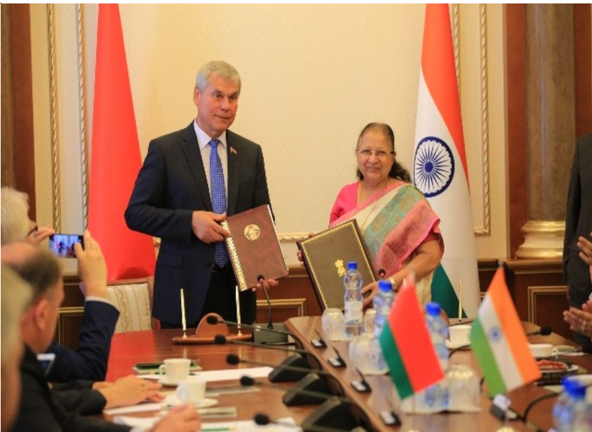
Lok Sabha Speaker, Smt. Sumitra Mahajan exchanging the Agreement for cooperation between India and Belarus Parliaments with Chairman of House of Representatives of National Assembly of Belarus, Mr. Vladimir Andreichenko, at Minsk (Belarus) on 11 June, 2018.