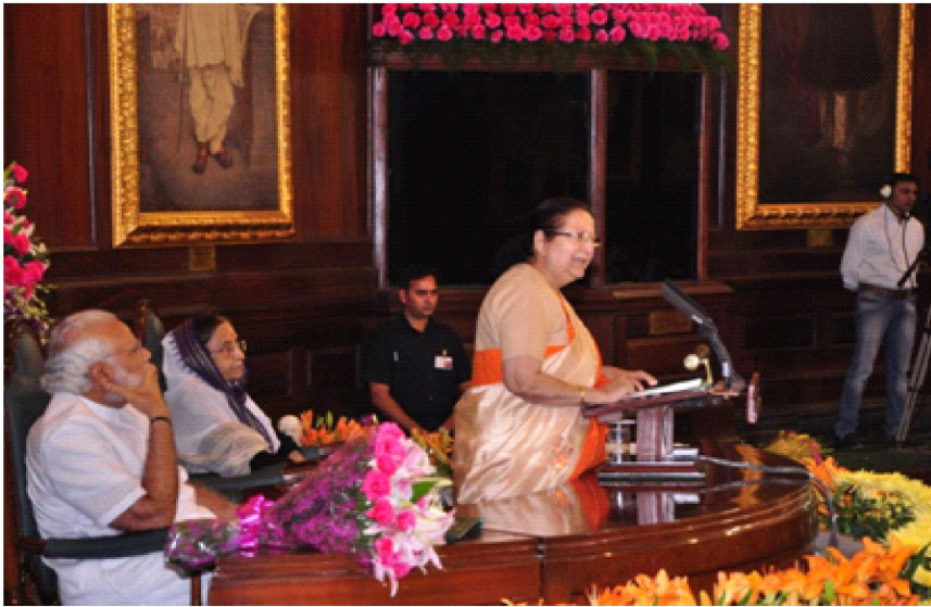
The former President of India, Smt. Pratibha Patil, addressing the Valedictory Session. The Prime Minister of India, Shri Narendra Modi and the Lok Sabha Speaker, Smt. Sumitra Mahajan are on the dias.