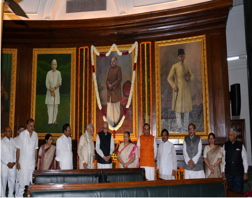
Prime Minister, Shri Narendra Modi; Lok Sabha Speaker, Smt. Sumitra Mahajan; Lok Sabha Deputy Speaker, Dr. M. Thambi Durai; Several Union Ministers and former Deputy Prime Minister and Chairperson of the Ethics Committee (Lok Sabha), Shri L.K. Advani, paid floral tributes at the portrait of Dr. Syama Prasad Mookerjee in the Central Hall of Parliament House on his birth anniversary on 6 July, 2018.