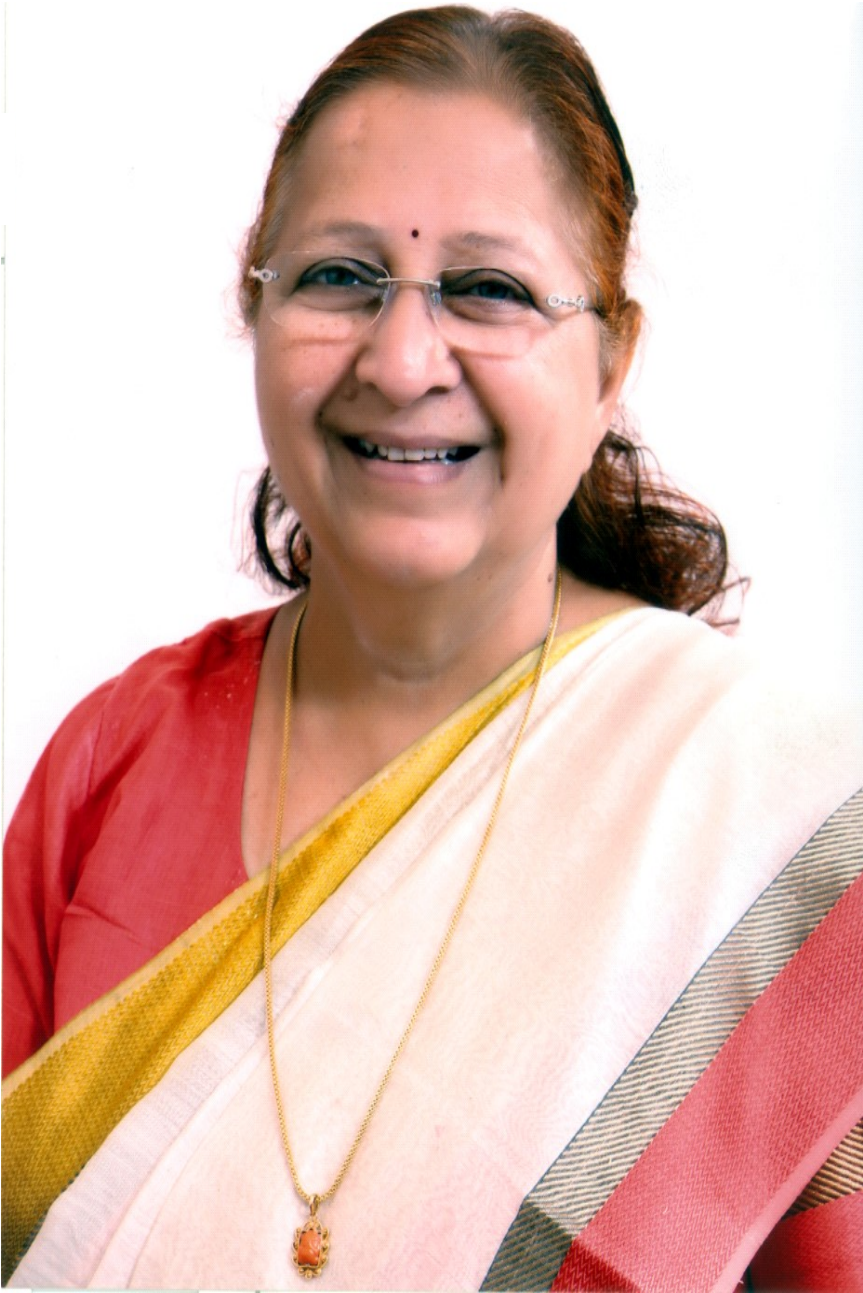
SMT. SUMITRA MAHAJAN Hon'ble Speaker, Lok Sabha