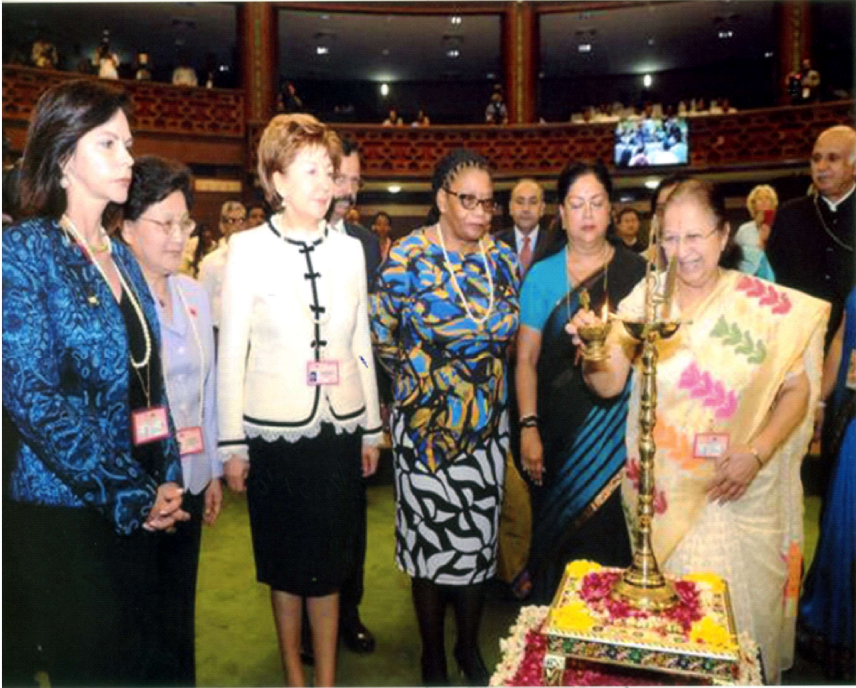
Hon'ble Speaker of Lok Sabha, Smt. Sumitra Mahajan and other dignitaries at the lighting of the Lamp Ceremony of Meeting of the BRICS Women Parliamentarians' Forum, Jaipur, Rajasthan, August, 20-21, 2016.