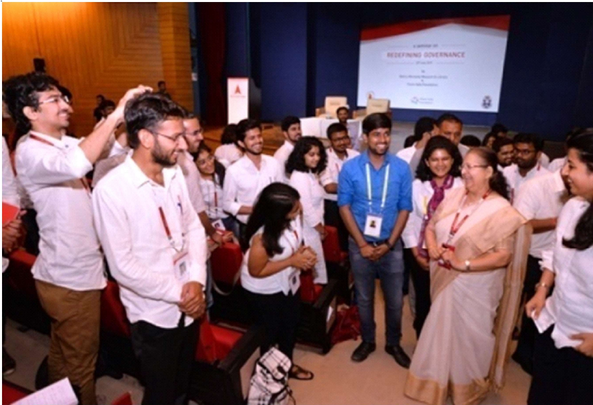
Lok Sabha Speaker, Smt. Sumitra Mahajan interacting with more than 160 students and alumni from premier institutes like IITs, NLU, Yale, LSE, Manchester under a programme organized by the Vision India Foundation in New Delhi on 22 June, 2018.