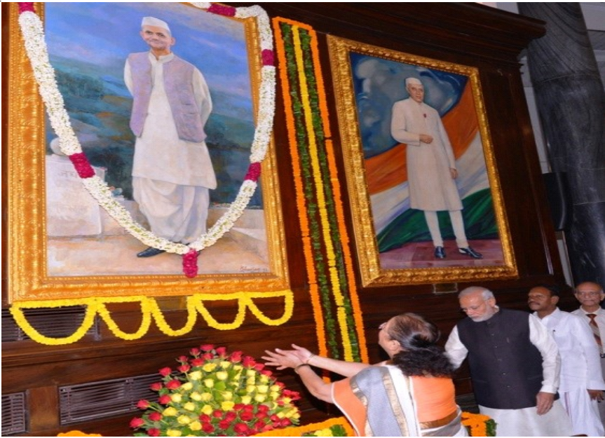
Lok Sabha Speaker, Smt. Sumitra Mahajan paying floral tributes at the portrait of Shri Lal Bahadur Shastri in the Central Hall of Parliament House on the occasion of his birth anniversary on 2 October, 2018.